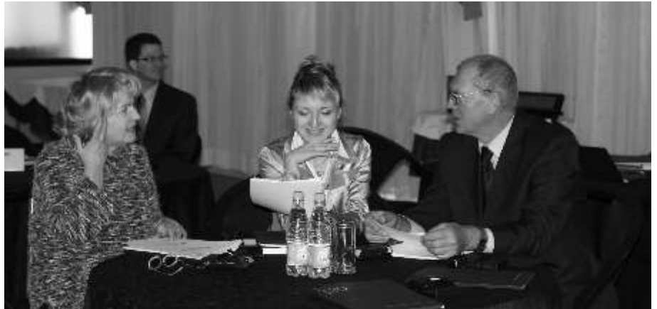
Обсуждение в ходе семинара «Возможности углеродного финансирования»

В рамках финансовых инструментов Киотского протокола в белорусскую экономику в течение первого периода обязательств (2008—2012 гг.) может быть привлечено от 500 до 750 млн. евро. О том, каким образом белорусские предприятия могут воспользоваться углеродным финансированием, в частности, предоставляемым углеродными фондами Всемирного банка, шла речь на семинаре «Возможности углеродного финансирования» для представителей органов государственного управления и разработчиков проектов.