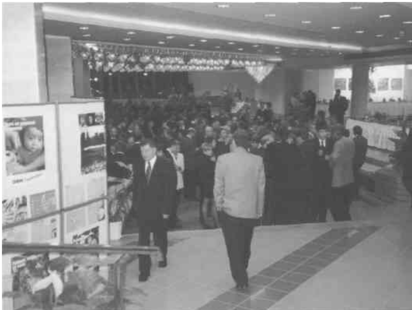
Прием по случаю Дня ООН

Поэтому необходимы особые критерии оценки для определения того, кто является бедным в Беларуси. Представительство Всемирного банка в Беларуси совместно с Министерством статистики и анализа Республики Беларусь разработало методологию оценки бедности, которая будет рассмотрена и принята на государственном уровне. В свою очередь, Всемирный банк планирует по мере возможностей помогать правительству Беларуси в искоре-