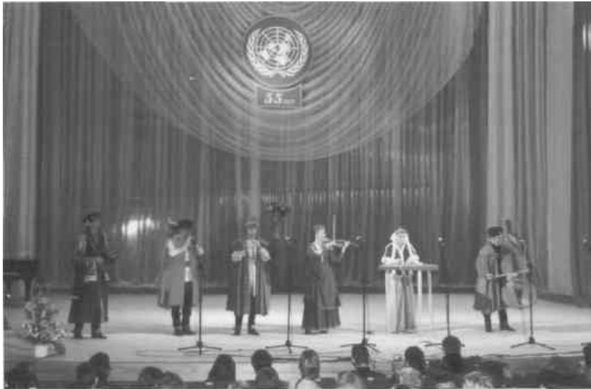
Концерт, посвященный 55-летию ООН