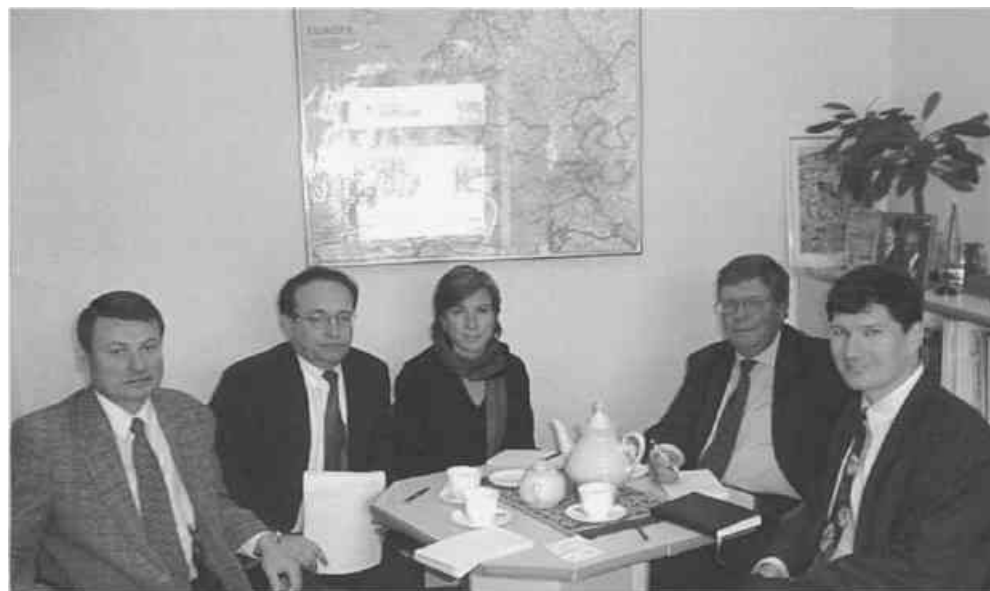
Миссия МОТ в Представительстве ООН в Беларуси

Отчет по результатам деятельности миссии в соответствии с процедурой, предусмотренной Международной организацией труда, предполагается рассмотреть на ближайшем заседании Комитета по свободе объединения.